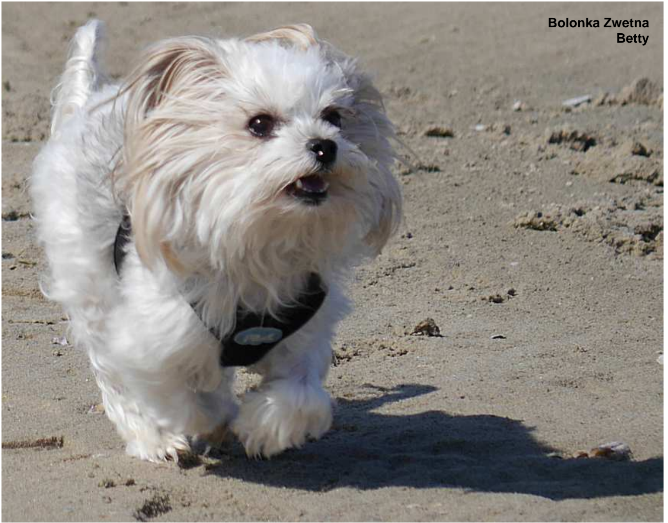
Bolonka Zwetna Betty