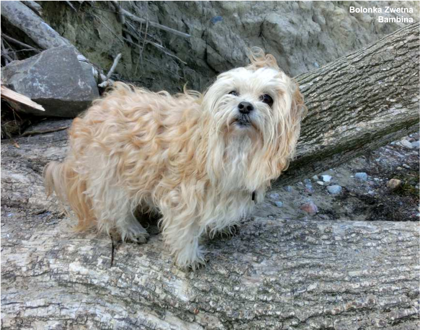
Bolonka Zwetna Bambina