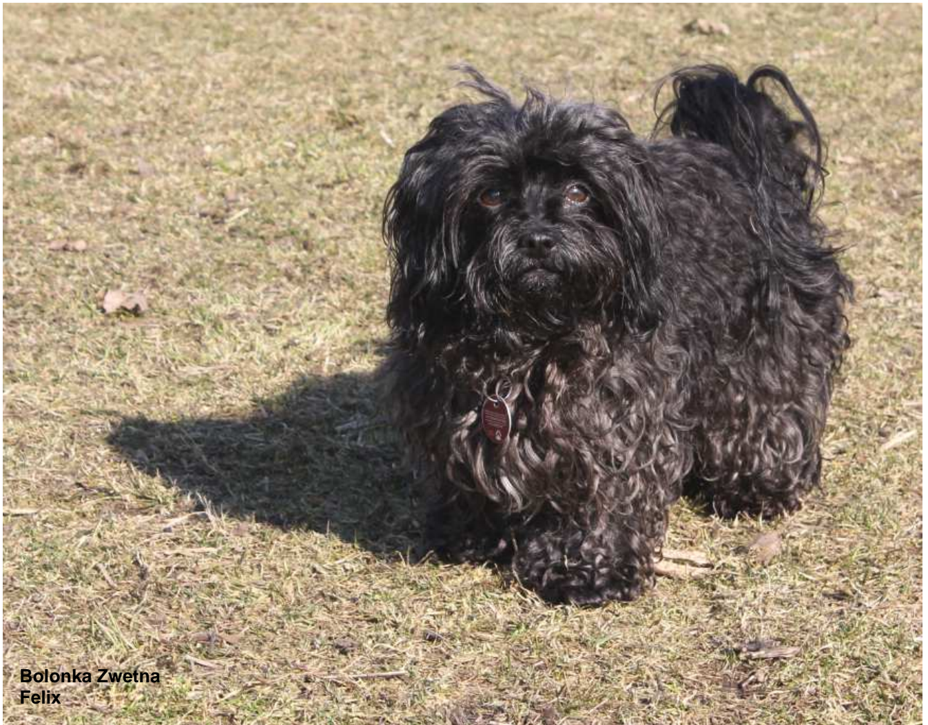
Bolonka Zwetna Felix