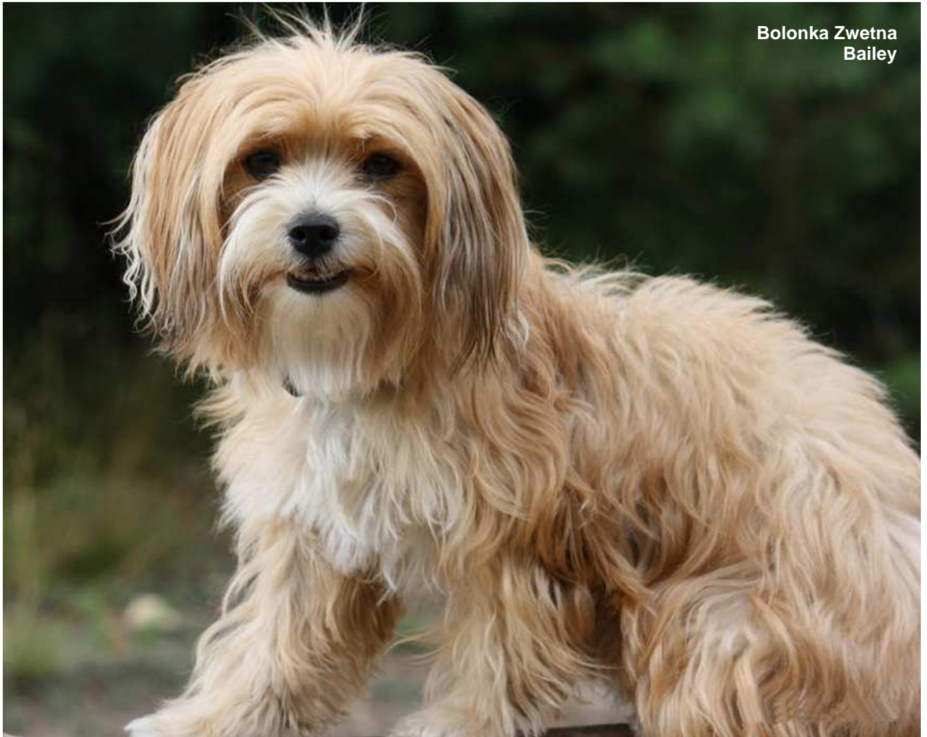
Bolonka Zwetna Bailey