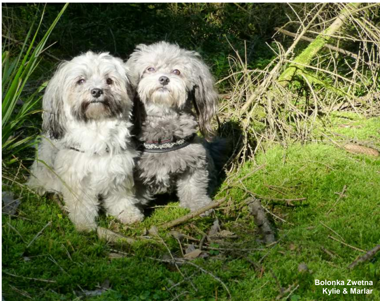
Bolonka Zwetna Kylie & Marlar