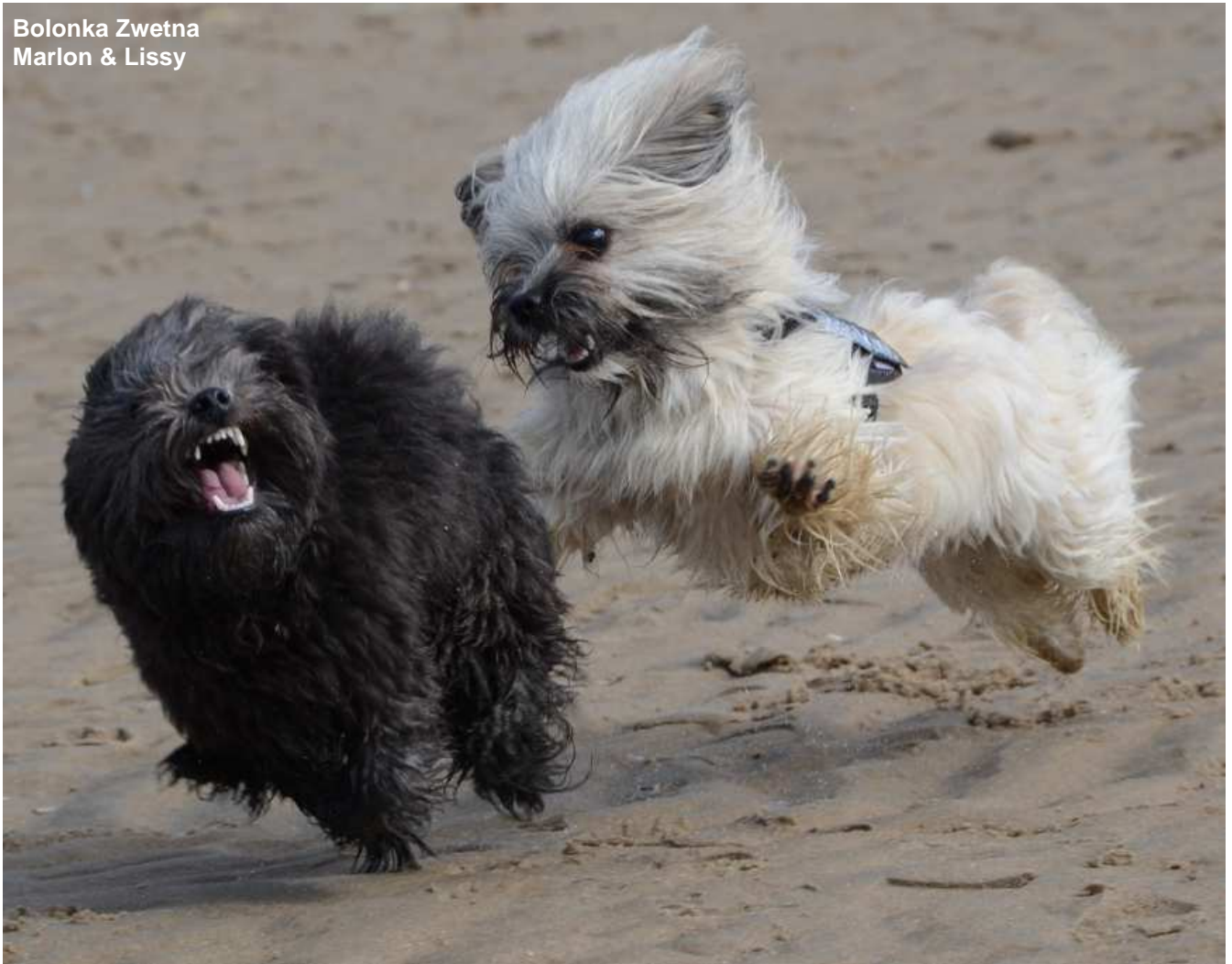
Bolonka Zwetna Marlon & Lissy