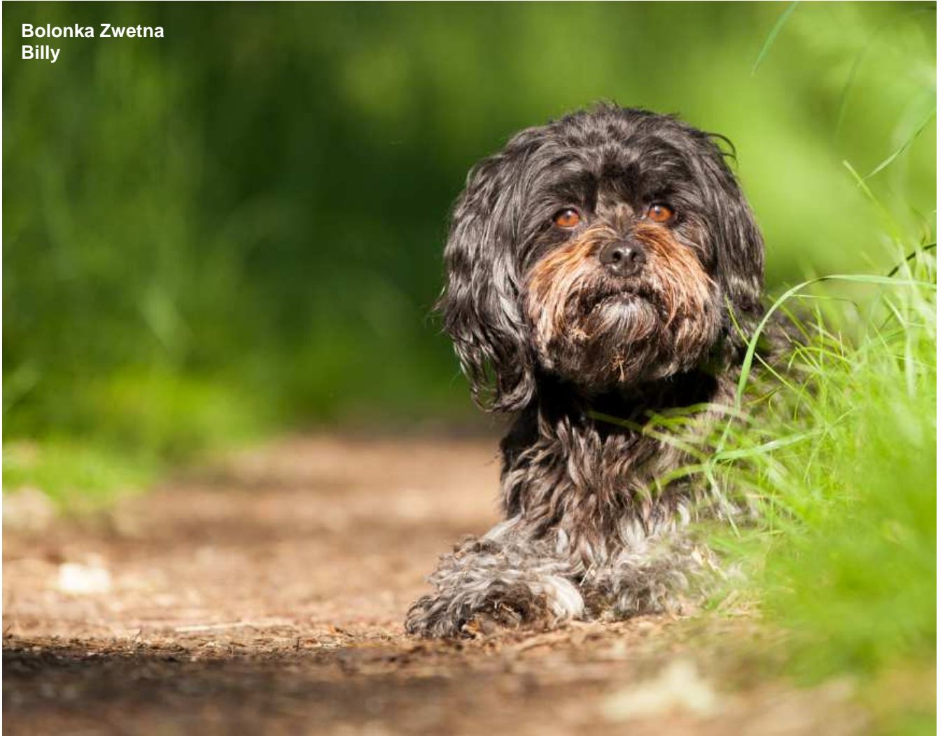
Bolonka Zwetna Billy