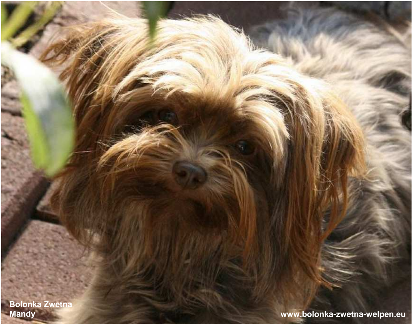
Bolonka Zwetna Mandy